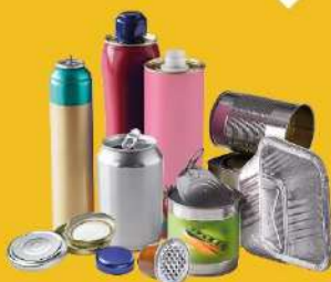
EMBALLAGES MÉTALLIQUES, MÊME LES PLUS PETITS